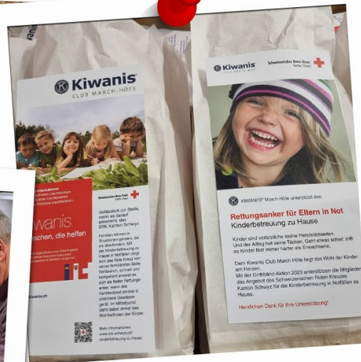
Grüttibänzaktion in Zusammen- arbeit mit Kiwanis Club March Höfe