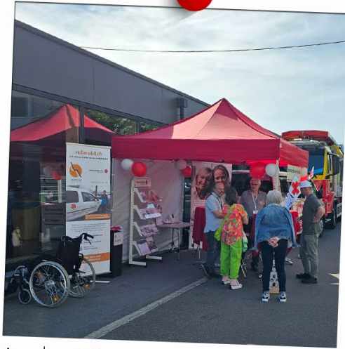
An der GEWA March in Galgenen, zusammen mit dem Rollmobil March-Höfe

Das SRK Kanton Schwyz war im 2023 auf verschiedenen Veranstaltungen unterwegs und setzte viele Projekte für hilfsbedürftige Mitmenschen um. Hier ein paar Impressionen: