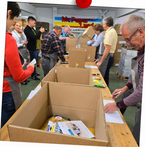
Aktion «2 x Weihnachten» bei Mc PaperLand in Tuggen (TV-Bericht bei @auftanken.TV)