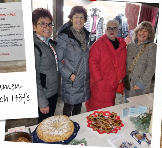
Am Lichtermeer in Schwyz