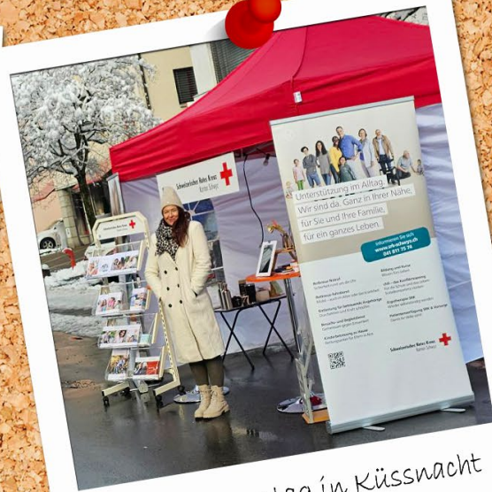
offener Sonntag in Küssnacht