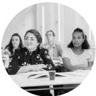
Bildung und Kurse