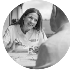
Entlastung für betreuende Angehörige