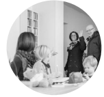
Kinderbetreuung zu Hause