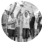
chili – das Konflikttraining