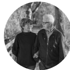
Patienten- verfügung & Vorsorge